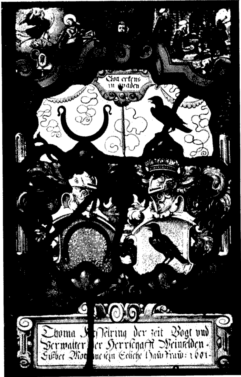
Abb. 1. Kesselring-Mötteli-Scheibe von 1601 Sammlung Mostell Church Nr. 444