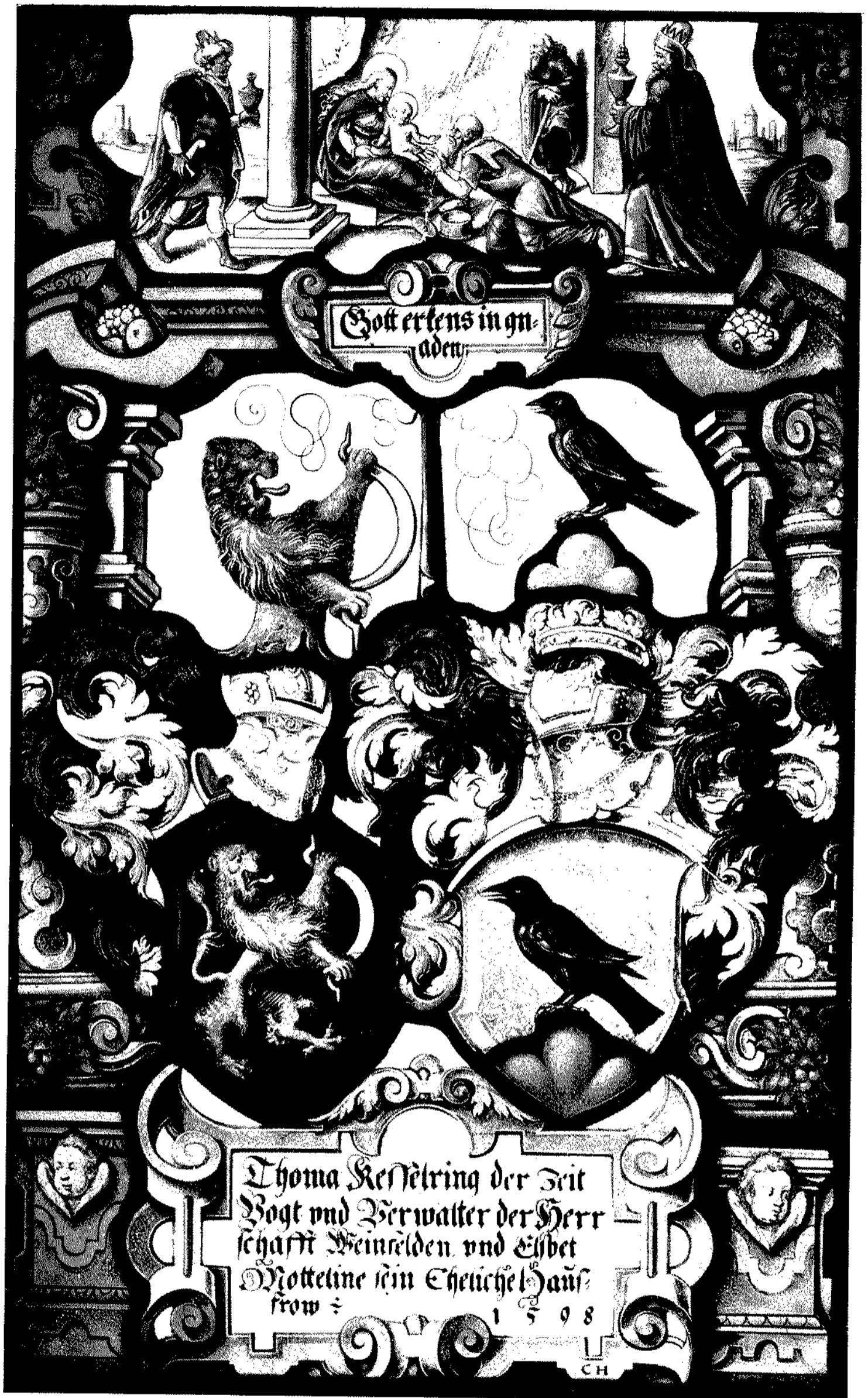
Abb. 2. Kesselring-Mötteli-Scheibe von 1598 Thurgauisches Historisches Museum. Aus Sammlung Vincent