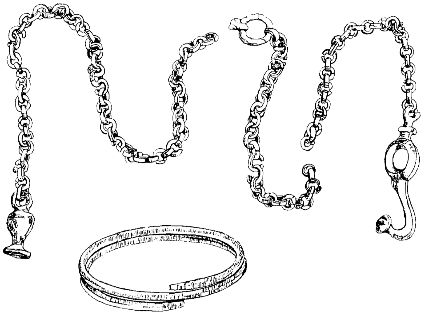
Abb. 1. Latènegrab Ermatingen. \frac{1}{2} Gr.